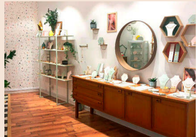
Dime Que Me Quieres ha abierto en Rambla Catalunya, 131.